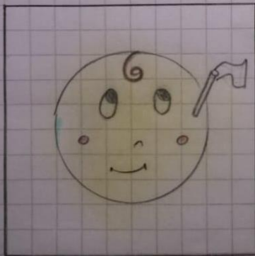
RIGHT TO A NATIONALITY