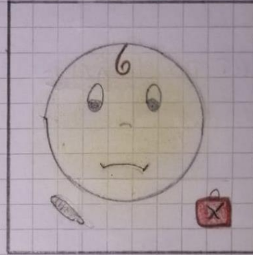
RIGHT TO HEALTH