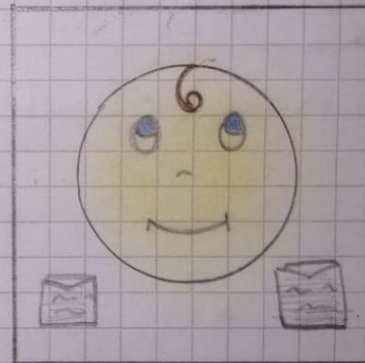
RIGHT TO EDUCATION