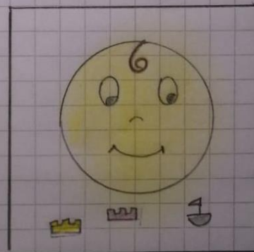
RIGHT TO PLAY