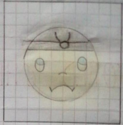
RIGHT TO WORK