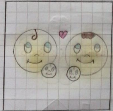
RIGHT TO A FAMILY