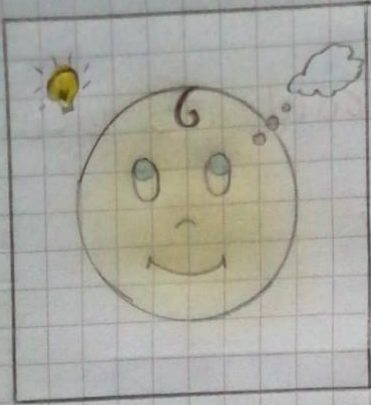
RIGHT TO AN OPINION