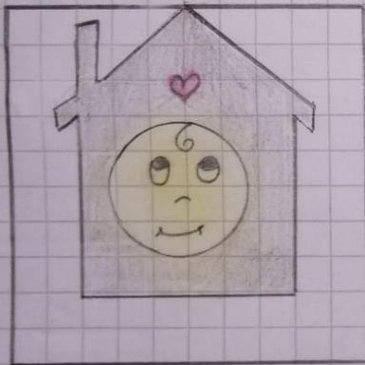
RIGHT TO A HOUSE