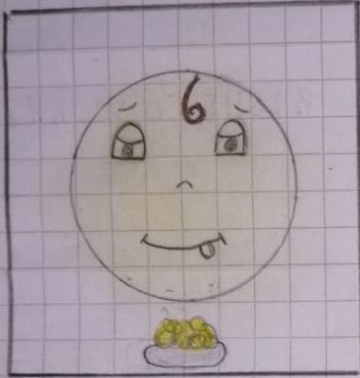
RIGHT TO FOOD